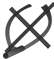
Antivol recommandé par les voleurs

4. Utiliser un antivol en U haute sécurité. Il est très rentable d'utiliser un antivol qui résiste plus de 10 minutes à un voleur confirmé, car les voleurs de vélos sont en général vite découragés par un antivol résistant. Un bon antivol coûte au moins de 40 d'euros et nous suggérons de le fixer en permanence sur le vélo pour l'avoir toujours à disposition (fixation souvent prévue). Evitez les antivols avec clé cylindrique. Il existe des clés passe-partout et on est parvenu à les ouvrir avec un bic. La marque ABUS renseigne sur la sécurité en fonction du type d'agression. Il existe aussi des normes de qualité des cadenas. Aux Pays-Bas, la Fondation ART ( www.stichtingart.nl/ ) teste les cadenas. Le Secrétariat à la Politique de Prévention (SPP) fait la promotion du test hollandais et un produit une brochure sur le bon cadenas.