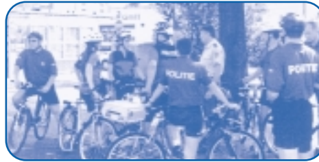
Brigade cycliste = Team Building : projet attractif, image moderne, volontariat, esprit d'équipe, formation, sorties communes